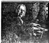
Joh. Seb. Bach

Een week later brengen wij U twee werkjes van de grote Mozart. Wie kent niet die heerlijke muziek van „Eine kleine Nachtmusik"? Niet minder heerlijk van muzikale smaak is het daarna volgende Serenata Notturna. Weer een Nachtmusiek dus. En het geheim van deze bekoorlijke melodieën schijnt